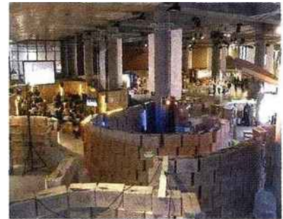
Total carton au World Forum Village.

Dix tonnes de carton. Les nouveautés de cette année ? Un formidable Village, fabriqué avec dix tonnes de carton fourni par