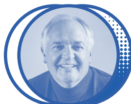
Paul POLMAN Grand speaker de cette 15 e édition Entrepreneur, pont de l'économie responsable, PDG d'Unilever de 2009 à 2019

Parmi les premières têtes d'affiche de ce line-up :