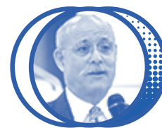
Jérémy RIFKIN , Foundation on Economic Trends (Etats-Unis), speaker éditions 2012 et 2018