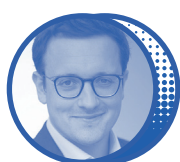
Ludovic SUBRAN , Chercheur en macro- économie, chef économiste du groupe Allianz, classé dans le top 100 des leaders français de demain par l'Institut Choiseul et le Figaro.