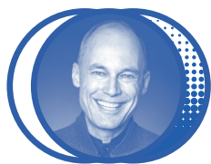
Bertrand PICCARD , Solar Impulse (Suisse), speaker édition 2019